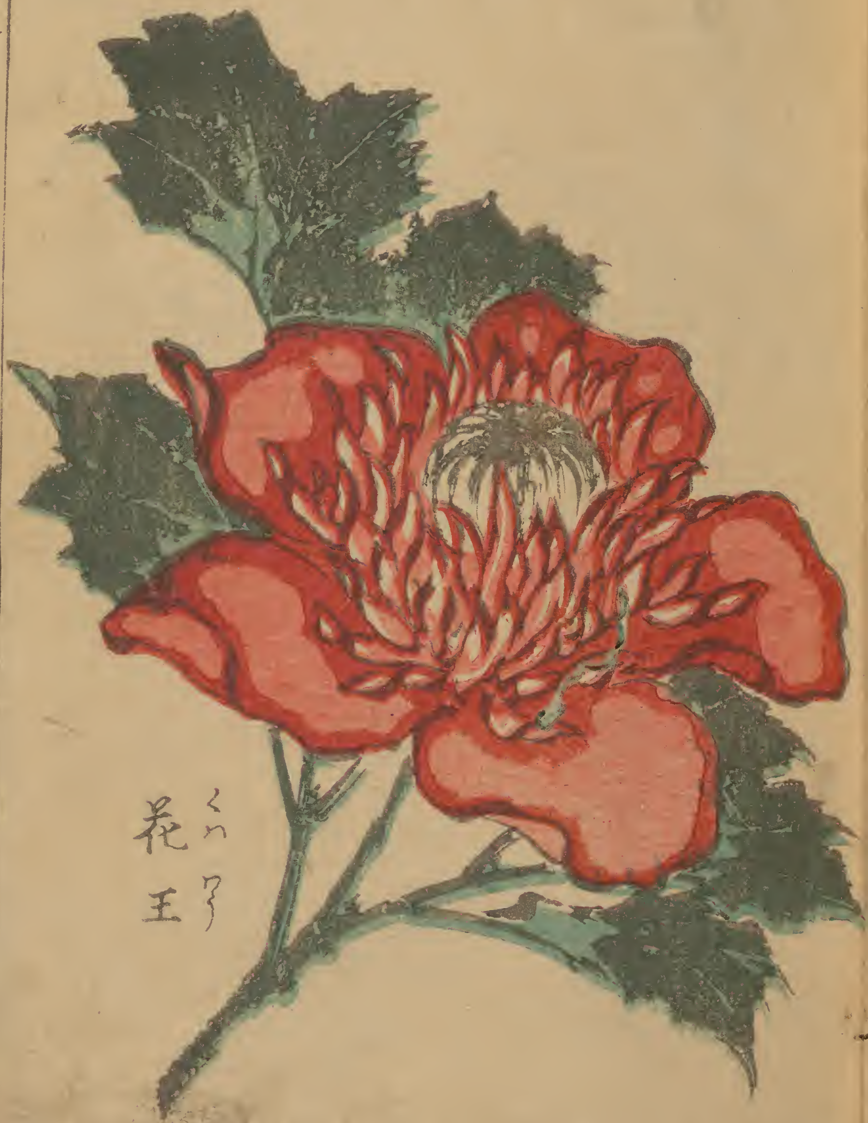
花王 くわ り